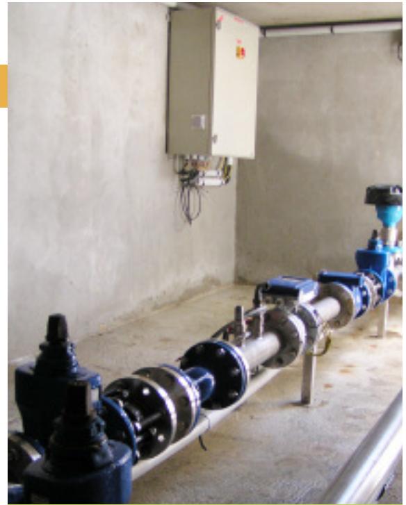
Le point de livraison de la branche Sud Est du réseau de l'IEMN situé sur la commune des Brunels.

« Dans une petite commune telle que la nôtre, nous sommes obligés d'être des gestionnaires rigoureux, plus encore qu'ailleurs. En ce qui concerne le volet eau potable, le partenariat avec l'Institution nous aura permis de supprimer des infra-