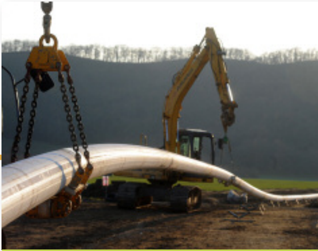
Les travaux de forage dirigé sous l'Agout se sont déroulés fin décembre 2016.

Depuis ce tronçon qui atteint la commune de Guitalens-L'Albarède partent deux antennes. La première antenne est longue d'environ 7 km. Elle dessert les